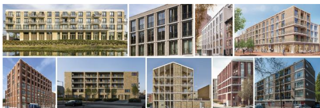
Voorbeelden van buitenruimtes en galerijen die binnen het hoofdvolume vallen en onderdeel zijn van de architectuur

Ook is er besproken dat het belangrijk is om aandacht te besteden aan het ontwerp van de entree, waarbij ook goed gekeken moet worden naar het type groen & beplanting en welk type hek hieromheen wordt geplaatst.