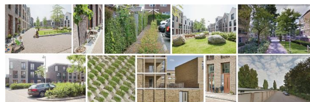
Impressie en sfeerbeelden openbare ruimte