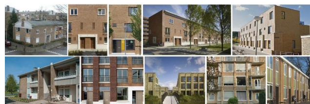
Voorbeelden van woningen met verticale nabewerkte penantie en daken met horizontale beplanting

Ook is er gesproken over het mee ontwerpen van de muren langs de tuinen die grenzen aan de openbare ruimte. Uitgangspunt hierbij is om een wildgroei aan verschillende soorten schuttingen te voorkomen. Daarnaast is het voor de inrichting en beheer van de openbare ruimte goed om dit met zorg te doen. Dus goed ontworpen groenstroken met speelvoorzieningen voor kinderen.